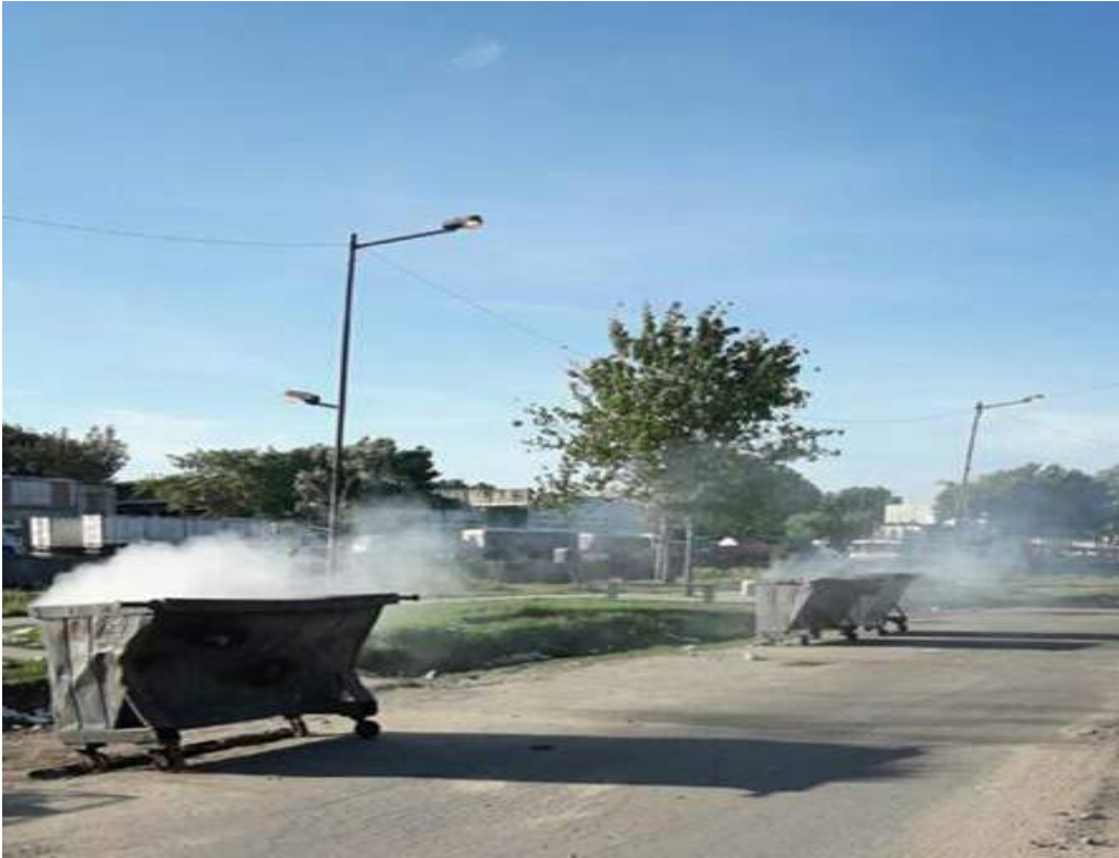
Volquetes incendiados- Calle Alte Brown - 08/11/18.

Con respecto a la limpieza de espacios comunes, cabe destacar que no son pocos los esfuerzos que se hacen para limpiar por parte de algunos vecinos. Ellos mismos refieren que la basura vuelve a aparecer. Algunas cooperativas ligadas a Barrios de Pie y CTEP hacen limpieza en el barrio, pero como no alcanzan a limpiar la totalidad de la basura desparramada, y como el sistema es ineficiente se vuelve a ensuciar.