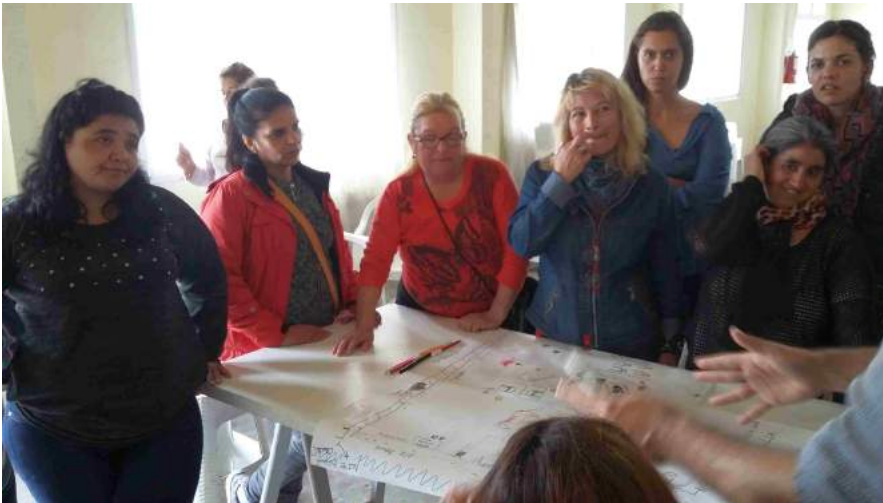
Vecinos realizando cartografía social en el CIS - 15/09/18

A esta primera acción participativa se hizo una convocatoria a través de flyers, incluyendo a todos los referentes entrevistados y se dejó en algunos negocios del barrio y en algunas instituciones. La concurrencia fue de 15 vecinos.