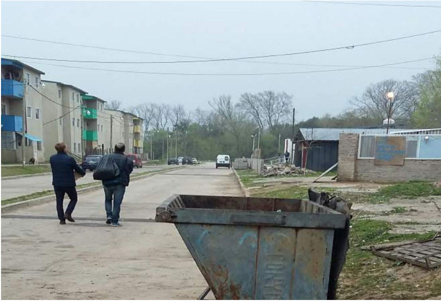
Volquete en sector de "Edificios" - 05/10/18