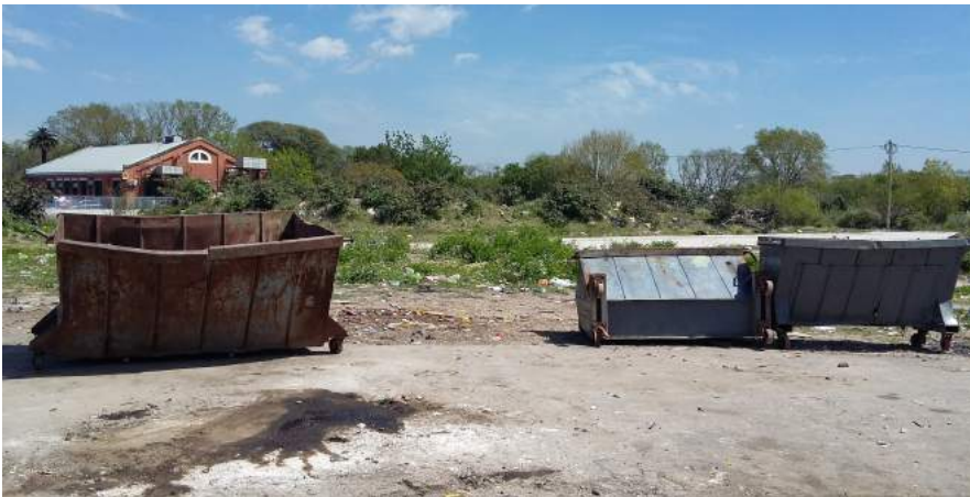
Volquetes en sector de "canchita" - 05/10/18

Cada edificio tiene además un canasto grande que usualmente rebalsa de basura suelta y se puede encontrar basura desparramada alrededor del canasto. Esto sucede porque algunos vecinos que sacan la basura sin bolsa, dan vuelta el tacho de basura sobre el canasto. También tiran basura suelta en los volquetes. Se encuentran canastos en el sector de los edificios y sobre la calle Almirante Brown. Los volquetes y canastos son