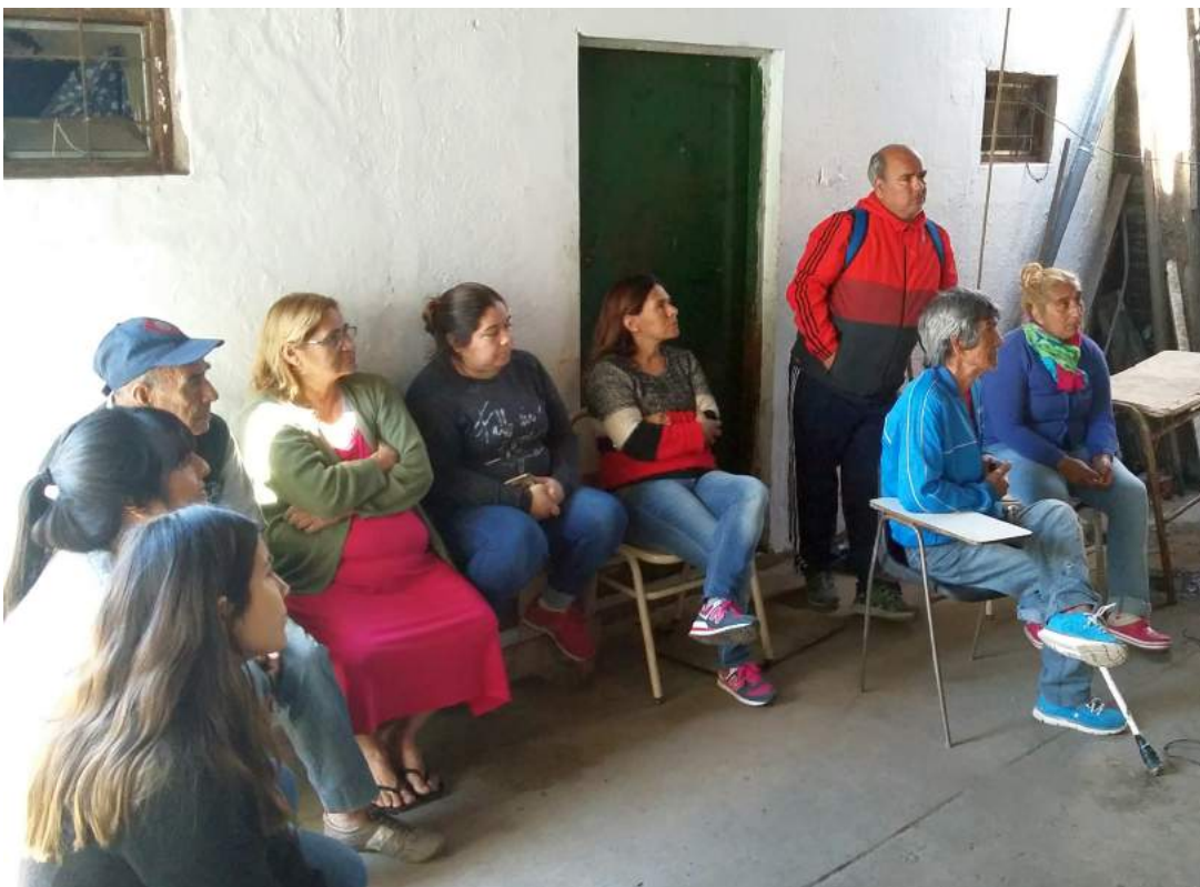
Reunión de la Red de vecinos en La Bloquera - 05/10/18

El 12 de octubre se realizó la segunda reunión de la Red de Vecinos para diseñar un circuito de recolección de basura. Definición de nuevos responsables por pasillo y en otros sectores del barrio. Funcionarios de OPISU nos proveyeron de una fotografía sacada por un dron que permitiera identificar en el mapa los pasillos y los vecinos responsables de promover la recolección.