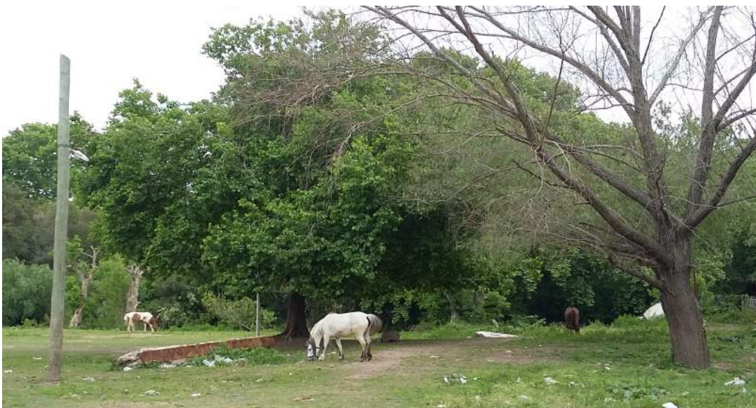
Caballos sueltos - 22/10/18 -Martin Gómez Escribano

hacia CABA u otros destinos para recolectar. Su grado de integración con el resto de los carreros es bajo.