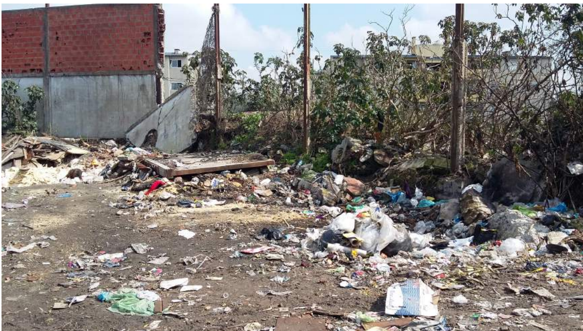
Microbasural en sector del “fondo” - 17/09/18

La recolección formal de basura se realiza a través de camiones de Transporte Olivos. Estos ingresan al barrio por las calles Alte. Brown y la calle de acceso a los edificios. Estas calles son paralelas y señalan los límites Norte-Sur del barrio. Las calles no llegan hasta el final del barrio, sólo hasta los dos primeros tercios desde el ingreso. Los camiones retiran la basura de los volquetes y de los canastos. Los camiones ingresan al barrio de Domingo a Viernes por la mañana. Lo usual es ver los volquetes vacíos en la mañana y rebalsando en la noche. Los entrevistados refieren que desde el 2015 se ha mejorado la cantidad de veces que el camión de basura entra, “antes era de una sola vez por semana, ahora es diario” .