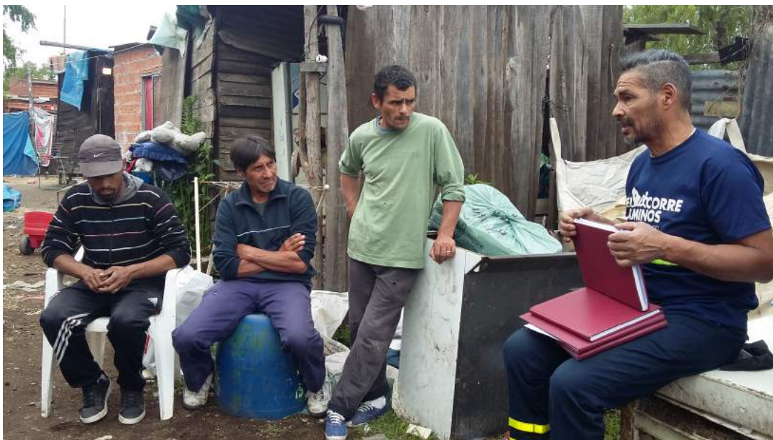
Reunión con Cooperativa Correcaminos - 04/11/18

En este último mes de noviembre, todos los Lunes y Viernes nos reunimos para seguir avanzando en el fortalecimiento de la incipiente cooperativa. Esto implica no solamente conversar sobre el proceso de armado de la cooperativa sino evaluar cómo se va realizando la recolección, que dificultades se van presentando y se discuten nuevas propuestas de funcionamiento. Por ejemplo el 04 de noviembre se realiza una reunión con los carreros en donde se les presenta un representante de la Cooperativa Correcaminos que comparte vivencias y hace recomendaciones.