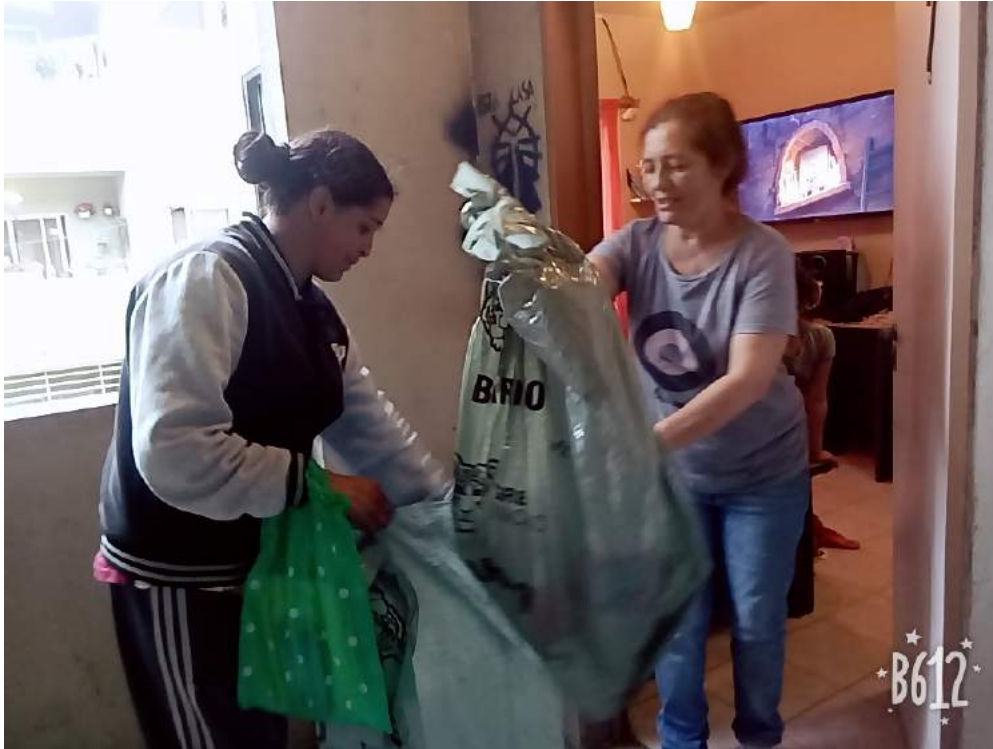
Recolección de los RSU separados en origen- 19/10/18