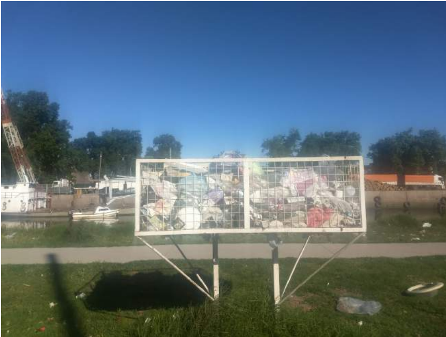
Canastos en la Calle Almirante Brown - 04/10/18 - Foto Rowina Andrada.

Antes del sector de los edificios y al lado de la cancha se pueden ver 3 volquetes , luego hay uno ubicado al inicio de la calle y otro al final. Cada edificio tiene un canasto para dejar las bolsas de basura. También sobre ellos tiran la basura suelta.