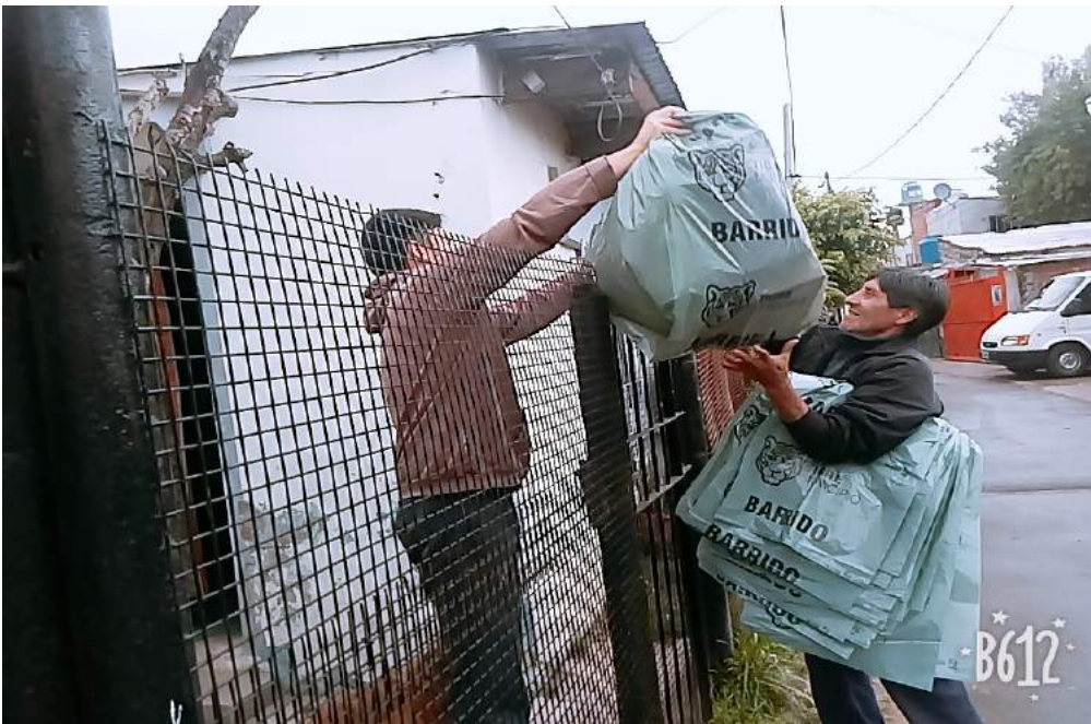
Recolección de los RSU separados en origen- 19/10/18