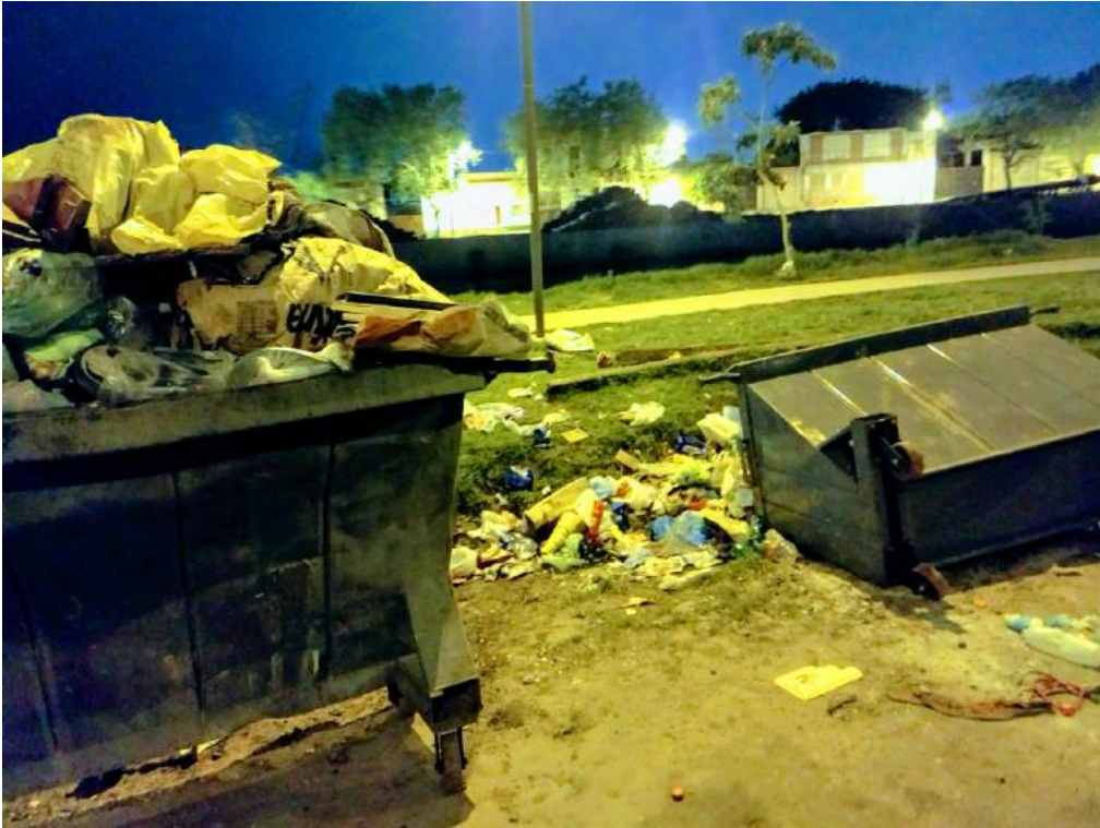
“Volquetes volcados” calle Almirante Brown -25/09/18

los quiere enfrente a su casa. También sucede que, durante la noche, algunos jóvenes los incendian como diversión.